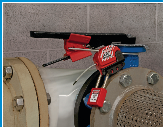
S3920 gesichert mit S806 Verriegelungskabel